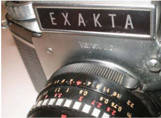
Exakta Varex IIb, #1087784 Leather case.

The top plate is engraved with the logo Ihagee Dresden. On the front plate there are FP (synchro at 1/30) and F (while Aguila and Rouah write about X, 1/60). The diameter of the heads of the screw on the frontplate is larger than in the preceding version. The camera is in fine condition, works well